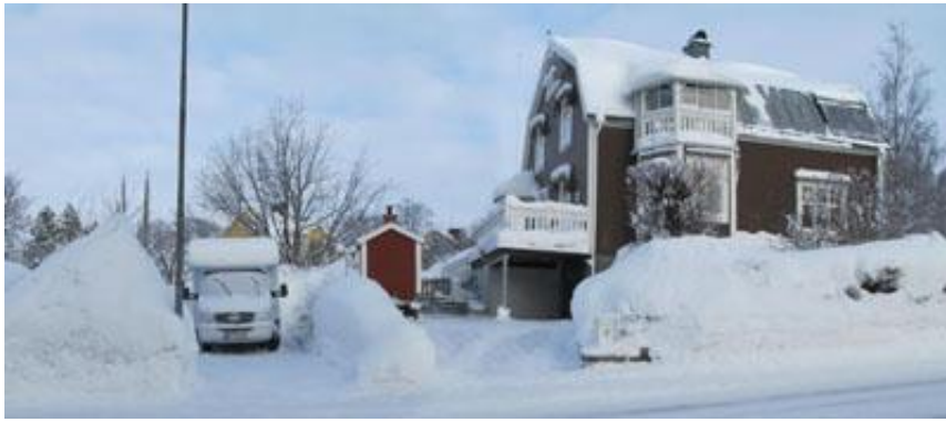
Snöhögen vid lyktstolpen bredvid husbilen var nästan 4 meter hög!