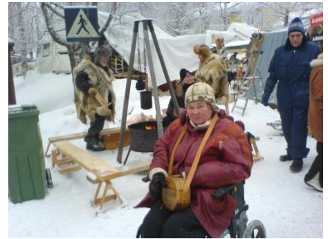
I februari testade vi om vår nya vinterhusbil skulle hålla måttet på Jokkmokks marknad. Det var helt OK, men så var det bara ca 12-15 grader minus.