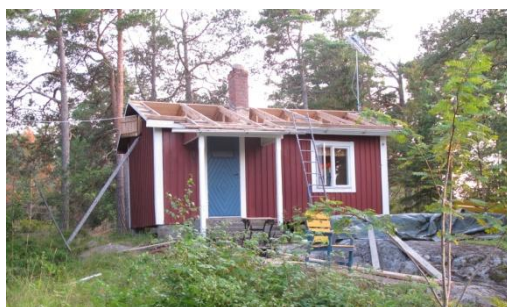
Årets renovering hemma blev målning av östra väggen på vårt hus. I Grisslehamn blev det att byta tak på ett av husen och på utbyggnaden på ett andra hus.