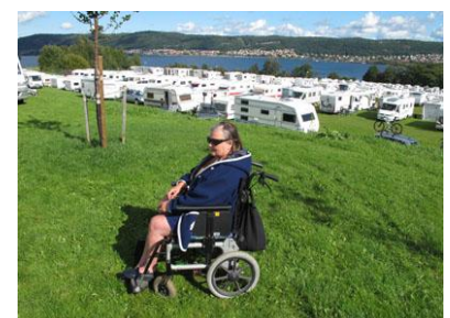
I år spenderade vi flera dagar på Elmiamässan. Otrolig mängd husbilar och husvagnar! Trevlig samvaro bland andra Nordic Husbilsägare och flera av Nordics personal.